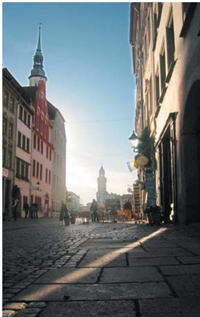
... em Gorlitz, fronteira com a Polônia, 21,6% das pessoas não têm trabalho