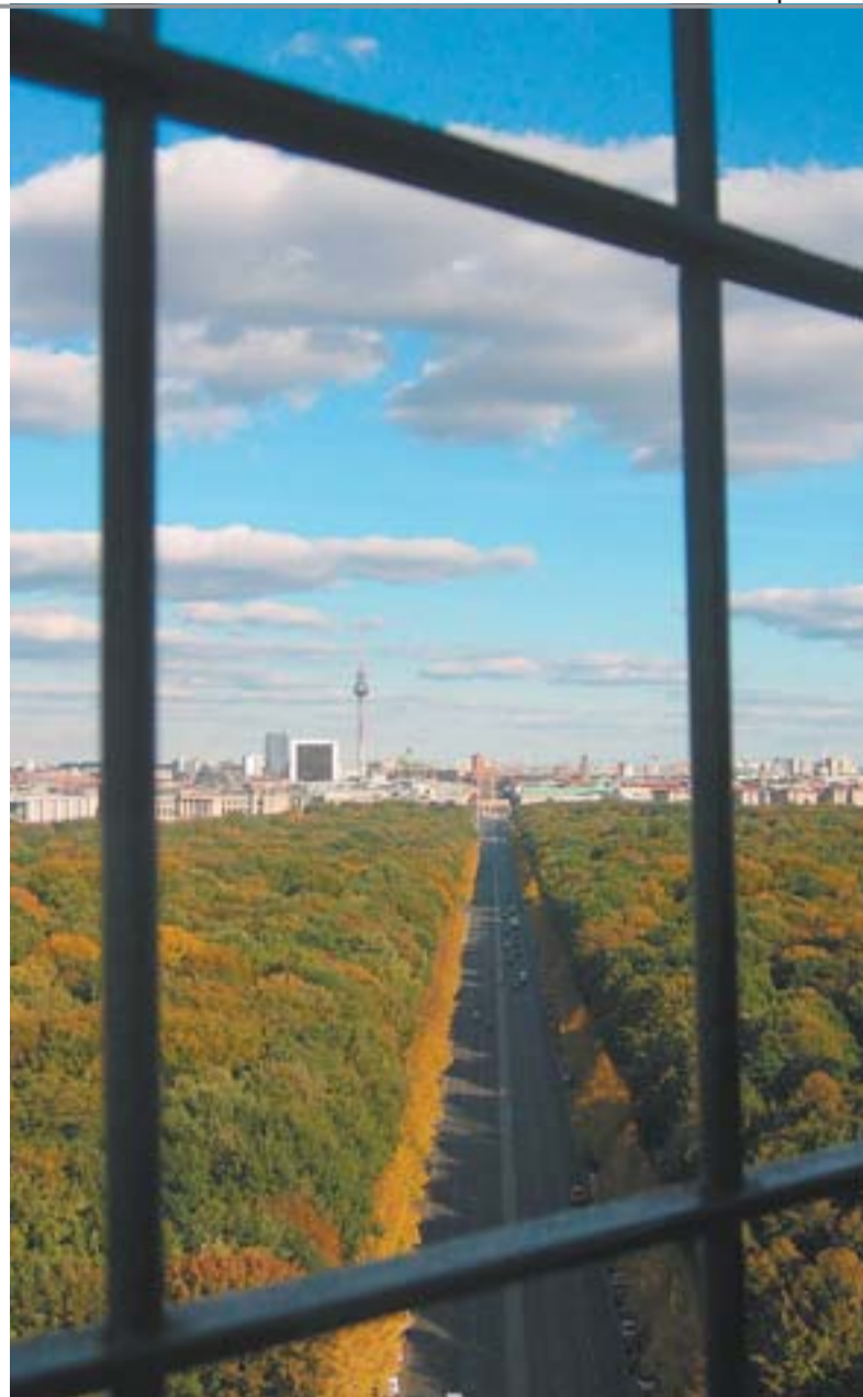
Enquanto estudantes vão a Berlim (acima) entender a reunificação do país...