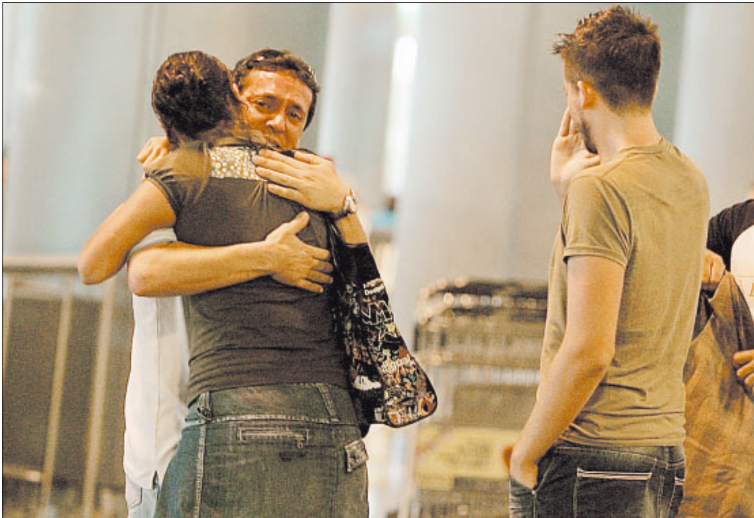
PARENTES E AMIGOS de passageiros do voo acidentado se emocionam no Aeroporto de Las Palmas, em Gran Canaria: avião não saiu de Madri

O incêndio se dividiu em dois focos e provocou uma densa cortina de fumaça, que podia ser vista de várias partes de Madri. As chamas levaram quase duas horas para serem apagadas. Dois helicópteros voaram até o local para jogar água sobre o terreno anexo ao aeroporto para evitar que o fogo se espalhasse.