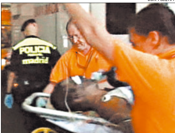
A TV espanhola mostra uma vítima sendo levada de maca por paramédicos