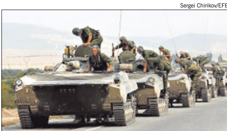
RUSSOS ENTRAM em seus tanques nos arredores da cidade de Gori

Em Moscou, o Conselho da Federação, como é chamada a câmara alta do Parlamento rus-