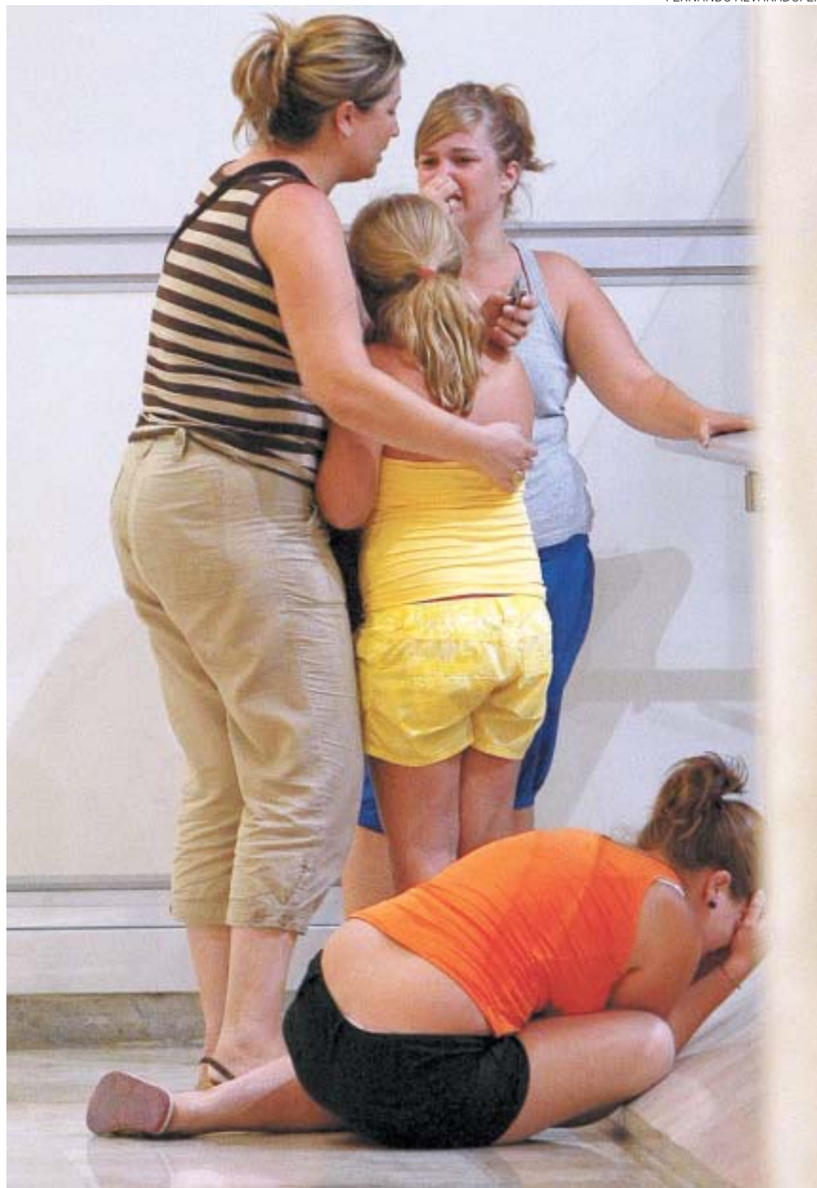
DESESPERO – Parentes de vítimas se consolam no aeroporto de Barajas: isolamento da imprensa

passos largos no Hospital La Paz. “Meu filho estava no avião, mas não quero falar. Estou tonto com tudo isso”, balbuciou. Alguns feridos tiveram queimaduras graves em todo o corpo.